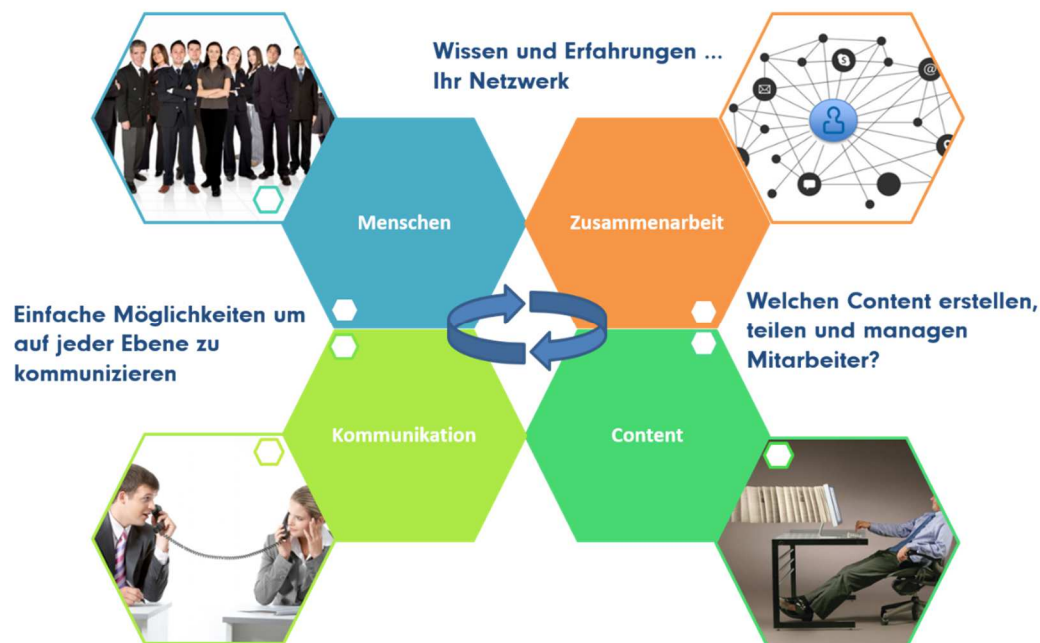
Abbildung 1: Zusammenhänge zwischen den Inhalten, den Kommunikationsanforderungen und den Menschen und deren Zusammenarbeit.

Gleich welche Nutzungsweise als notwendig angesehen wird, die Nutzer benötigen an ihren Arbeitsplätzen ausschließlich ihre gewohnte Microsoft® Office Umgebung.